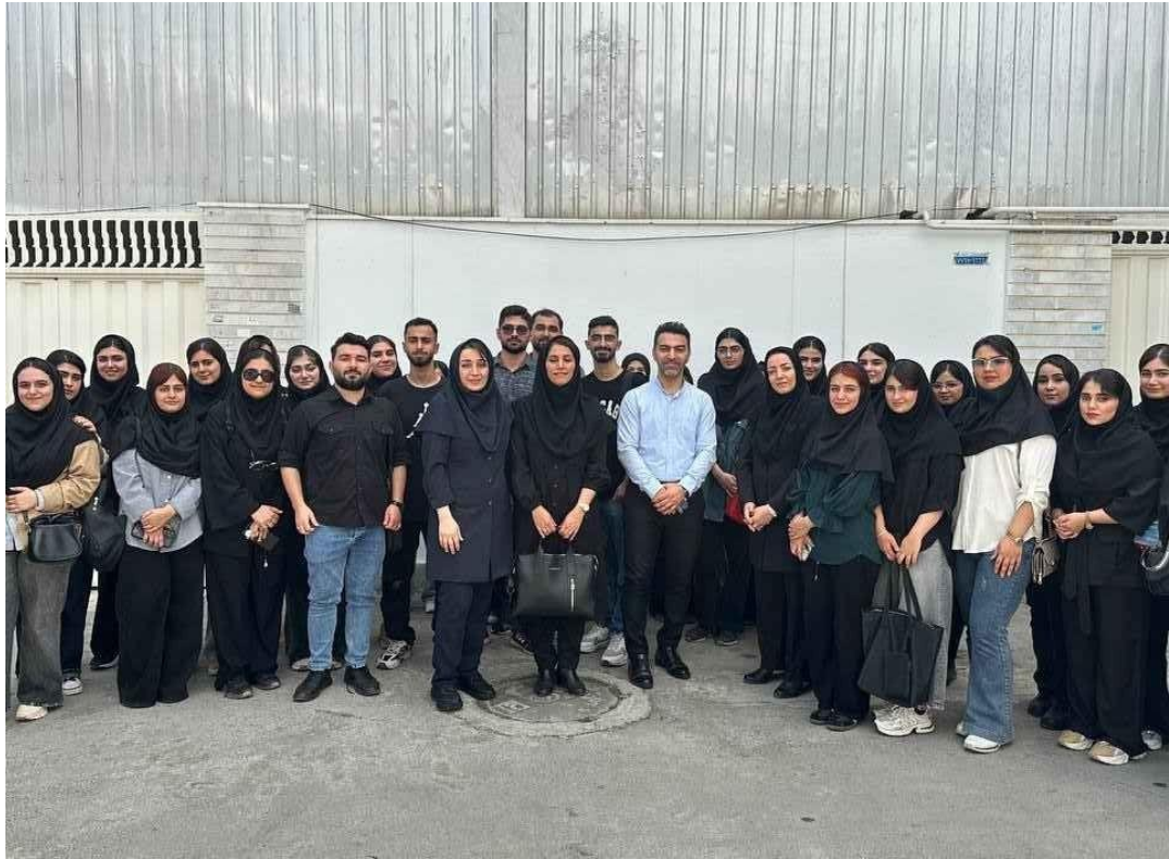
۱۶- بازدید علمی - آموزشی دانشجویان مهندسی پزشکی از اتاق عمل، بخش CPR و بخش دیالیز بیمارستان شهید بهشتی