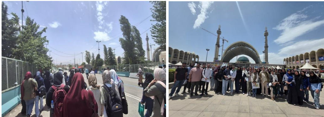
۱۱- بازدید علمی دانشجویان عمران از "کارخانه سیمان نکا".