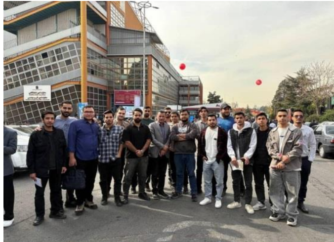
۱۰- اعزام دانشجویان به "نمایشگاه بین‌المللی کتاب" با همکاری انجمن علمی کامپیوتر.